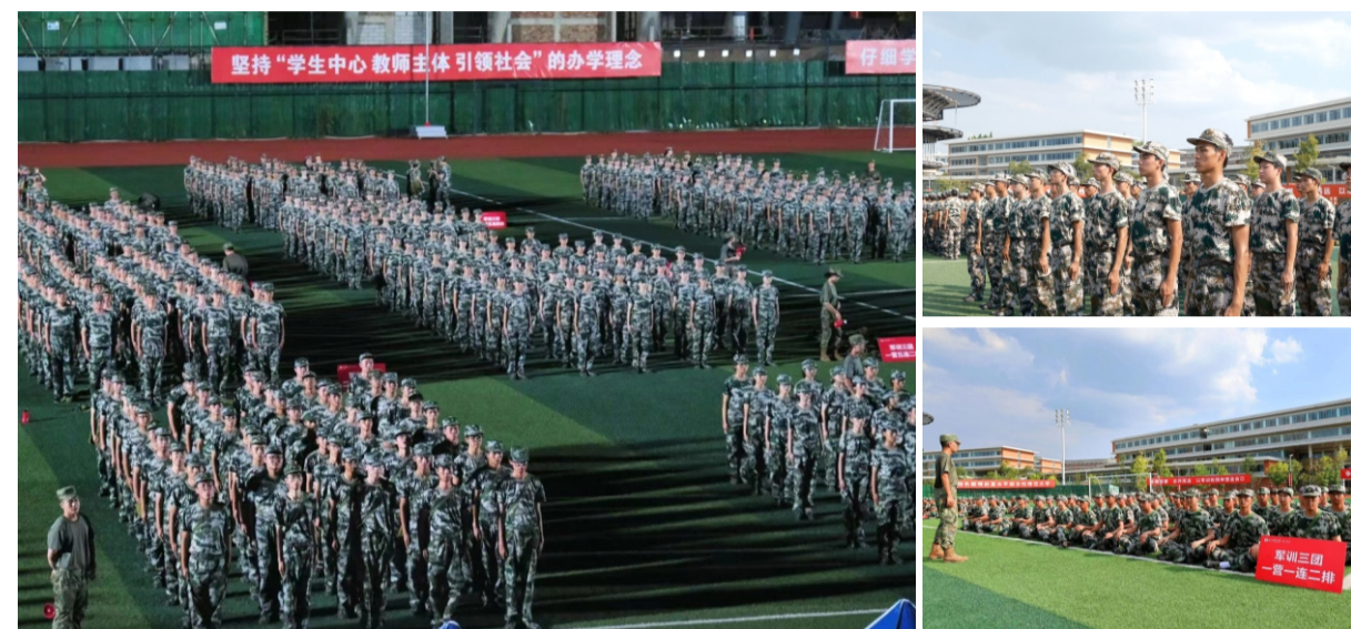
(三团各连正在进训练)

军训既是爱国主义和国防意识教育，也是一次对体魄的锻炼和对意志的磨砺。秋日已至，暑气未退，室外稍一运动便能“挥汗成雨”。正值青春的小狮子们迎难而上，无惧似火骄阳，通过磨砺铸就成长，践行着川师“重德博学 务实尚美”的校训。